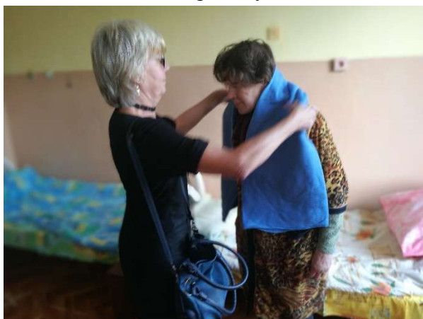
Kläder till behövande som ger värme inför kommande vinter delas ut. Församlingens diakoniarbete och Kommunens sociala nätverk känner till många fattiga människor med stora behov.