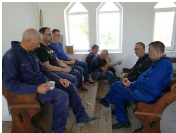
Vi hade också möjlighet att hjälpa till med att bygga en kyrka i Zaslonava. Mat- och kafferaster är viktiga och några historier.