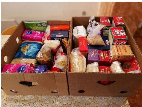
Mat som delas ut till fattiga familjer.