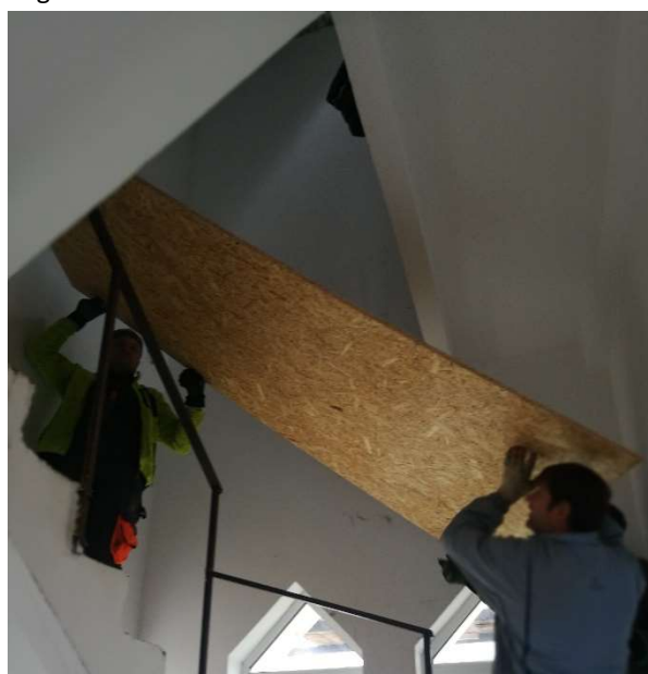
Skivor till övre salen.